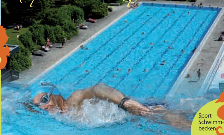
Sport- Schwimm- becken

Nicht nur das Springerbecken mit 1 m und 3 m Sprungbrett und das 50 m Sport-Schwimmbecken verführen ambitionierte Freizeitschwimmer zu sportlichen Leistungen, auch das Beachvolleyballfeld und die Tischtennisplatten erfreuen sich bei sportlichen Teams großer Beliebtheit. Wir bieten auch Schwimmkurse für Kinder und die Abnahme von Schwimmabzeichen an.