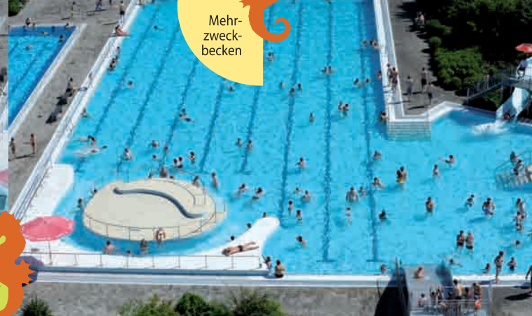
Mehr- zweck- becken